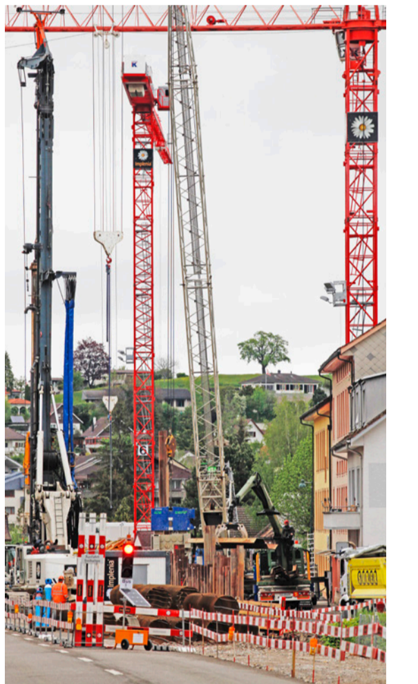
Dschungel in der Kranenwelt.