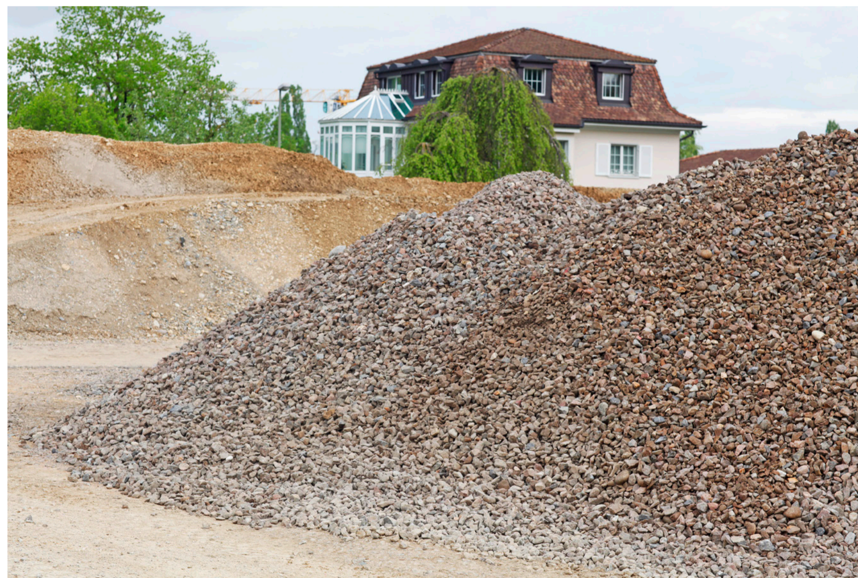
Schienenschotter im Zwischenlager.