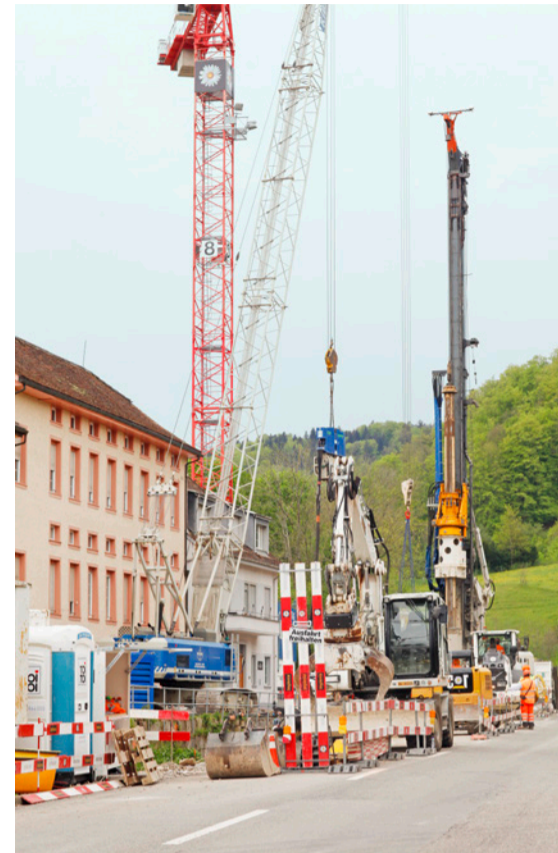
Die Baugeräte wachsen in den Himmel.

Waldenburg | Es lärmt, aber die neue Bahnstrecke nimmt schon erste Formen an