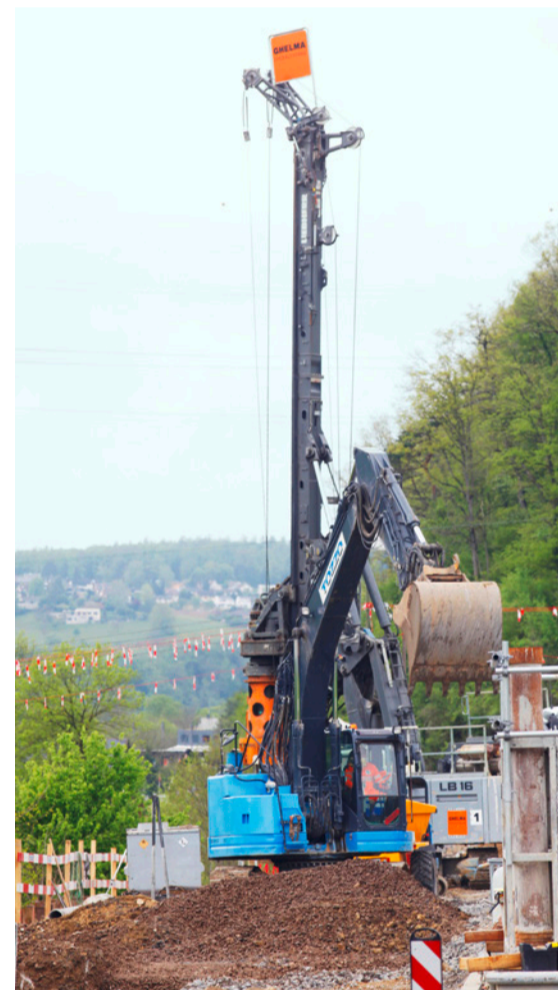
Für die Arbeiten braucht es schweres Gerät.