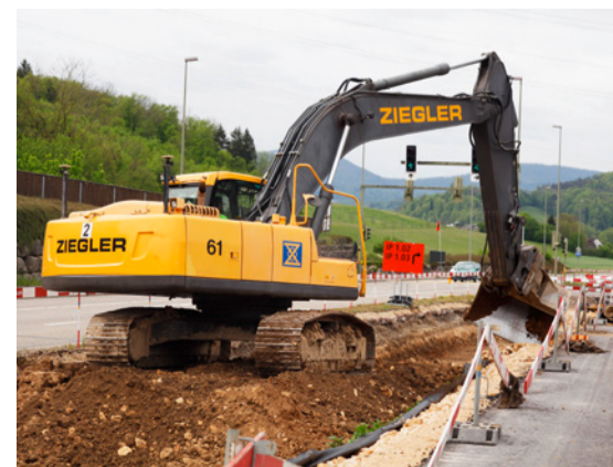
In Bubendorf fahren grosse Bagger auf.