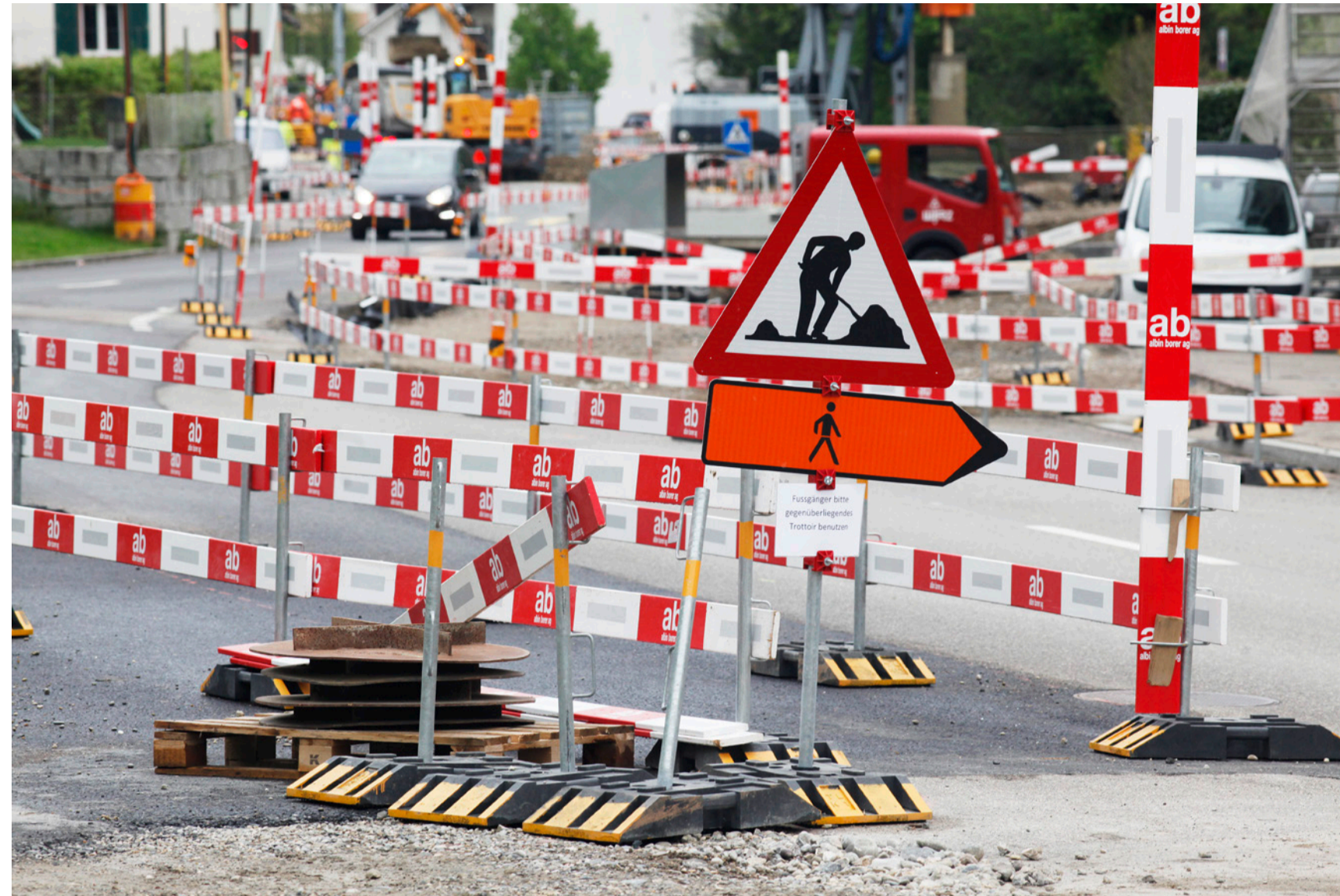
Gefühlte 500 Meter Hindernislauf.