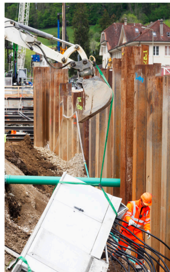
«Pahlbauten», einmal anders.